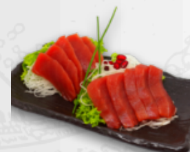
65 Thunfisch 12 €