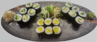
OiShi 7 (Vegetarisch) 11,00€