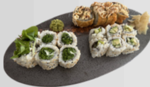
OiShi 8 (Vegetarisch) 13,50€