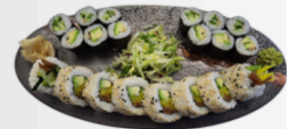
OiShi 9 (Vegetarisch) 12,50 €