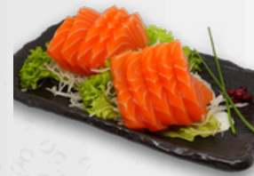
64 Lachs 10 €